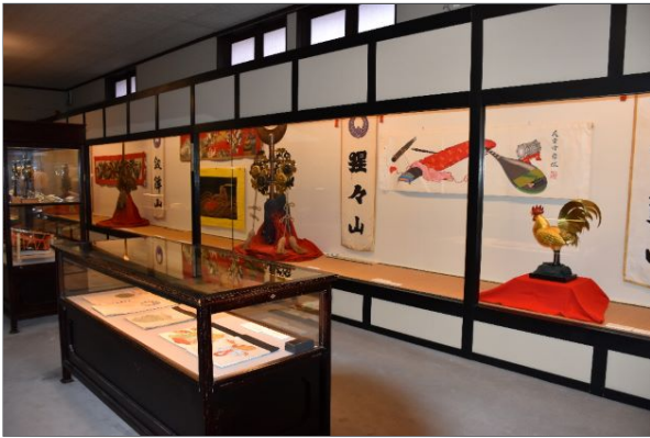
春日神社の祭礼を彩る品々が一堂に会しました