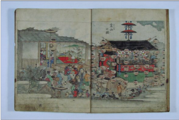
春日神社祭礼の様子が描かれた「春山春日御社図」